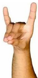
Рис. 2. «Коза»