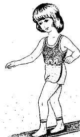
Рис. 3. «Ходьба маленькими шажками»