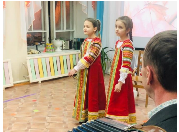
Участники мероприятия «Фейерверк талантов» на базе МДОУ «Детский № 12 «Солнышко»