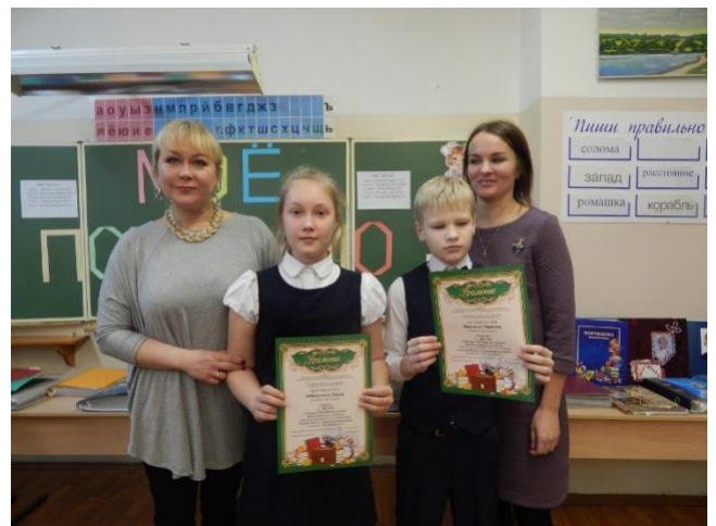
Участники мероприятия «Созвездие талантов» на базе МОУ «СОШ № 3»